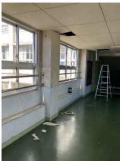
渡り廊下2階天井落下状況